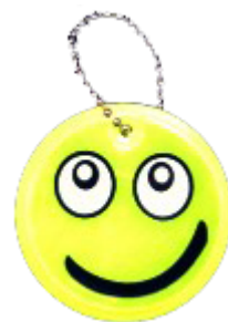
На поливинилхлоридной основе (ПВХ)