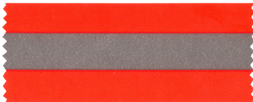
На текстильной основе

По утверждению специалистов, самое подходящее место, где стоит разместить световозвращатель – это грудь и бёдра, но чаще люди предпочитают прикреплять световозвращатели на кисти рук, свои портфели или сумочки. Самый оптимальный вариант, когда на пешеходе находится как минимум 4 световозвращателя.